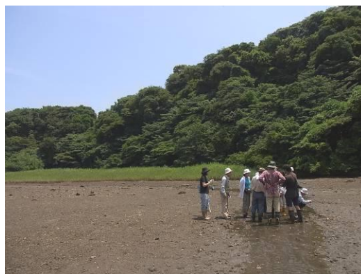
7月3日特別干潟観察会の様子

小網代を指定して下さるトラスト緑地保全支援会員の皆さんの自己申告を受け、調整会議と日常的に交流していただける小網代応援団の組織化を目指しています。小網代の森緑地の保全に協力していただけるトラスト緑地保全支援会員1000名、応援団300名を目指します。小網代を指定して下さっているトラスト緑地保全支援会員であればどなたでも登録できます。当事務局あて応援団登録申請お待ちしております。事務局より、特別自然観察会（年2回実施予定）などのお知らせをさせていただきます。くわしくは事務局まで。